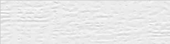
Verkehrsweiß RAL 9016