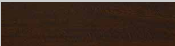
Night Oak ■ NEU