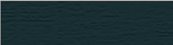
Anthrazitgrau RAL 7016